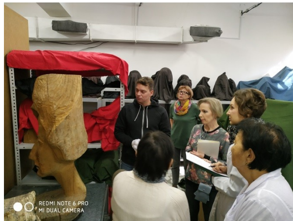
Консультация реставратора из Санкт-Петербурга