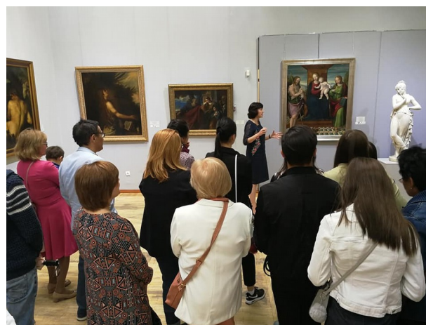
Экскурсии в Ночь в музее, 18 мая 2019

Музей қызметіндегі маңызды бағыттардың бірі көрме-экспозиция жұмысы болып табылады. 2019 жылы 65 уақытша көрме өткізілді: 3 көшпелі+48+15 (ОКЗ) , соның ішінде 13 халықаралық. Халықаралық жобаларда музей 2019 жылы РФ, Жапония Италия, АҚШ, Қырғызстан, Германия, Қытай, Корея және Өзбекстанмен ынтымақтастықты жүзеге асырды.